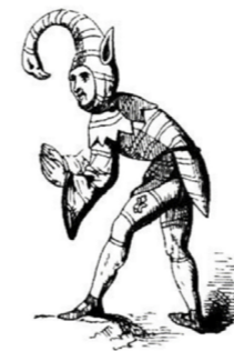
Preludio di Rodrigo Morganti

Original English Version included. Testo originale in lingua inglese a fronte.