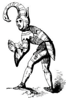
Preludio di Rodrigo Morganti

Original English Version included. Testo originale in lingua inglese a fronte.