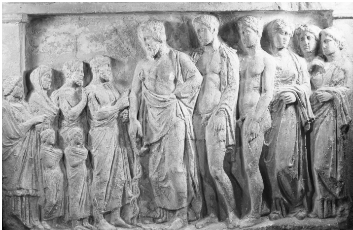
Fig. 7: Rilievo votivo ad Asclepio. Atene, Museo Archeologico Nazionale, n. 1402 Svoronos.