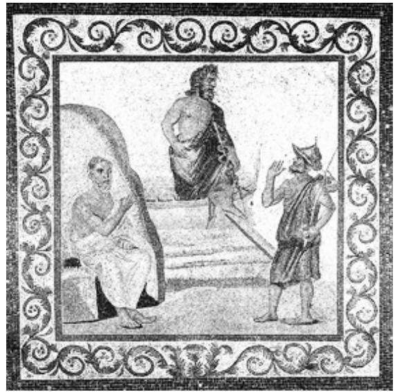
Mosaico da Cos. Vi è rappresentato Asclepio che scende da una nave e fa il suo ingresso sull'isola di Cos accanto a una guardia o un contadino. Sulla sinistra un uomo seduto, da molti identificato come Ippocrate, fa un gesto di benvenuto.

in conto i sogni dei pazienti che vi afferivano cercando conforto e sanazione dai propri mali. Sui rimedi farmacologici e principi di dietetica che venivano contemplati. Sui consigli che lo stesso Asclepio poteva fornire ai beneficiari delle sue cure.