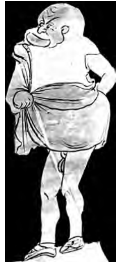
Attore che interpreta uno schiavo in una farsa fliacica; cratere a figure rosse del Gruppo di Lentini-Manfria, circa 350-240 a.C. Parigi, Museo del Louvre.

Solo con la fine degli anni Ottanta del secolo scorso, dunque nella piena maturità, Lanza ha avviato e proseguito sistematicamente l'esplorazione dei testi comici antichi con particolare e più frequente attenzione per Aristofane preferito a Menandro. I saggi compresi in questa raccolta e ordinati cronologicamente consente ora di cogliere le linee portanti e i punti salienti di un lavoro critico penetrante, sempre molto documentato e, al contempo, sempre molto personale nel metodo e nell'individuazione dei problemi interpretativi. Come negli studi sulla tragedia, Lanza si accosta alla commedia incrociando le competenze linguistiche e testuali del filologo con il punto di vista dello spettatore appassionato e intenditore dei meccanismi dello spettacolo. Così, il doppio piano e la doppia chiave di analisi fanno affiorare dalle drammaturgie conservate ipotesi di possibili messe in scena e fanno intravedere lo spettacolo attraverso la scrittura. Il fil rouge delle analisi di Lanza sui testi comici va così intrecciando due intuizioni feconde, l'individuazione dello straordinario ruolo del primo attore nella commedia e la riconduzione del buffone antico alla figura antropologica dello sciocco ripresa e modificata anche dalla Commedia dell'Arte italiana.