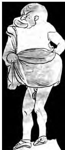
Attore che interpreta uno schiavo in una farsa fliacica; cratere a figure rosse del Gruppo di Lentini-Manfria, circa 350-240 a.C. Parigi, Museo del Louvre.

Solo con la fine degli anni Ottanta del secolo scorso, dunque nella piena maturità, Lanza ha avviato e proseguito sistematicamente l'esplorazione dei testi comici antichi con particolare e più frequente attenzione per Aristofane preferito a Menandro. I saggi compresi in questa raccolta e ordinati cronologicamente consente ora di cogliere le linee portanti e i punti salienti di un lavoro critico penetrante, sempre molto documentato e, al contempo, sempre molto personale nel metodo e nell'individuazione dei problemi interpretativi. Come negli studi sulla tragedia, Lanza si accosta alla commedia incrociando le competenze linguistiche e testuali del filologo con il punto di vista dello spettatore appassionato e intenditore dei meccanismi dello spettacolo. Così, il doppio piano e la doppia chiave di analisi fanno affiorare dalle drammaturgie conservate ipotesi di possibili messe in scena e fanno intravedere lo spettacolo attraverso la scrittura. Il fil rouge delle analisi di Lanza sui testi comici va così intrecciando due intuizioni feconde, l'individuazione dello straordinario ruolo del primo attore nella commedia e la riconduzione del buffone antico alla figura antropologica dello sciocco ripresa e modificata anche dalla Commedia dell'Arte italiana.