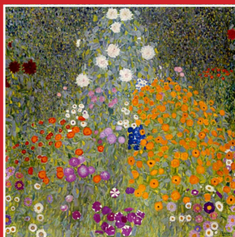
Bontempelli e Preve