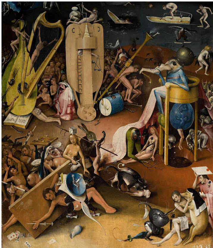
Hieronymus Bosch, Trittico del Giardino delle delizie, Inferno.

Associazione culturale senza fini di lucro