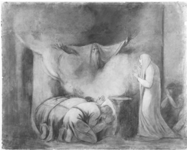
George Romney, L'ombra di Dario appare ad Atossa. Carboncino su cartone, 1778. Liverpool, National Museum..

Un errore che non commisero i Greci che pure contro l'Impero persiano si batterono, riportando due decisive vittorie a Maratona e a Salamina; nel loro proposito di definire la nozione di "civiltà occidentale", distinguendola dalla categoria di Occidente, Marino Badiale e Massimo Bontempelli rilevano come la contrapposizione tra Europa greca ed Asia persiana si accompagnasse nel mondo greco all'aperta individuazione della grandezza degli avversari, come si evince dalle Storie di Erodoto; la stessa definizione che attribuì loro di Barbari non esprimeva una valutazione negativa (di cui il vocabolo sarà portatore in seguito), ma si limitava ad indicare che non parlavano la lingua greca. Ricordano anche un dialogo platonico in cui Socrate risponde al giovane Alcibiade, il quale si ritiene per le sue doti degno di ottenere le più alte magistrature statali, che le sue qualità e risorse, notevoli per gli Ateniesi, contano ben poco di fronte a quelle di cui possono disporre i Persiani. 3