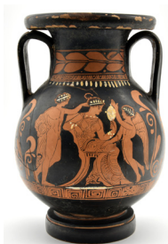
Postfazione di Anna Sturino