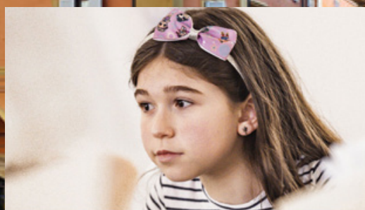
FilosoFare. Filosofia con i bambini